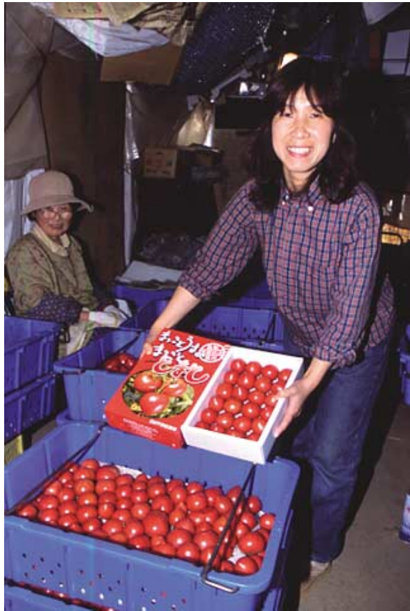
「まっことうまい まっことまと」は糖度10度以上が売り。ホームページも充実しているせいか、ネット販売が1割近くなるという。コンテナにバラ詰めしたり、袋に詰めたりしてスーパーに出す他、レストランにも納品する

ハウス全体に同時に水が出るように、本管（空中の太いパイプ）に水が行き渡ってから各ウネのかん水チューブに水がいくようにしている。かん水量が変わらないように、本管には空気抜き弁（飛び出た管）も付けている