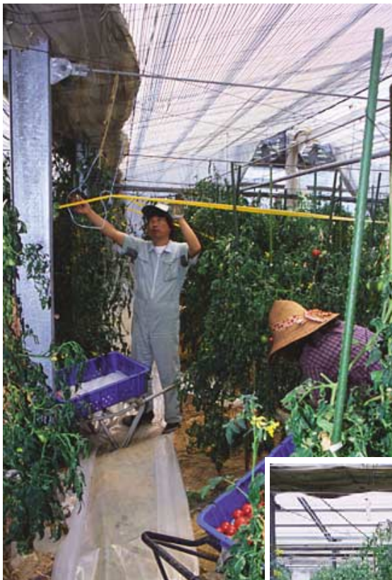
ハウスの谷間部分を別な角度から見たところ。暖房ダクトの分だけはトマトを植えていない