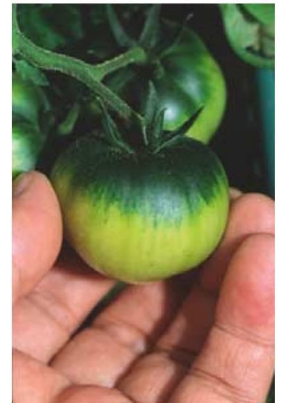
濃いベースグリーンがしっかり出ている。光線がよく当たっている証拠だ